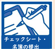
チェックシート・ 名簿の提出